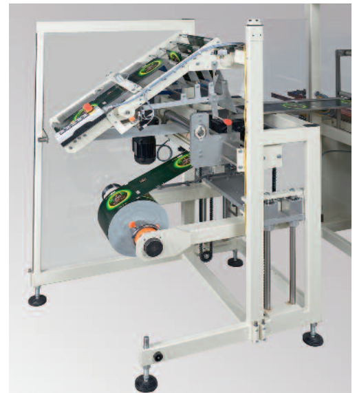
Rollenbock. Kann in Linie oder quer zur Transportrichtung aufgestellt werden.